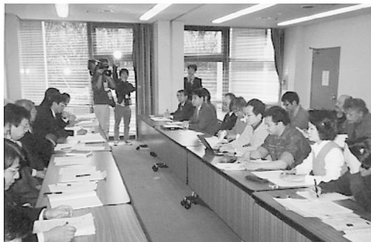
全国代表交渉団と厚生労働省等のお役人

これらの課題を突破するため、今後も全国の仲間と力を合わせながら国に私たちの要望を継続して突きつけていこうと思います。国がある程度の方向性を出したことにより、東京都や新宿区に対するたたかいもやり易くはなって来ました。自立支援センターを活用した就労支援対策や緊急援護対策について早急に改善を計って行きたいと思います。